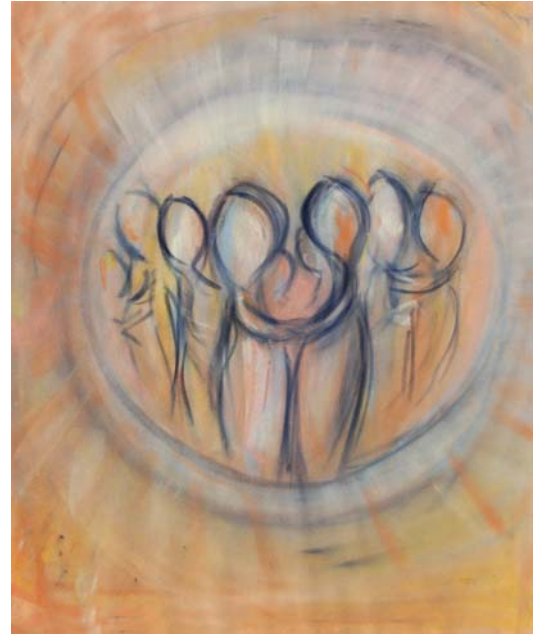
„aktiv zuhören – aufeinander eingehen“

Mit meiner Kunstserie „Begegnungen & Beziehungen“ hoffe ich, dass es mir gelingt Ihnen mitten ins Herz zu treffen. Denn B&B wurde geschaffen um zu „berühren“. Das Gefühl: „Schön, dass es uns gibt“ zu vermitteln.